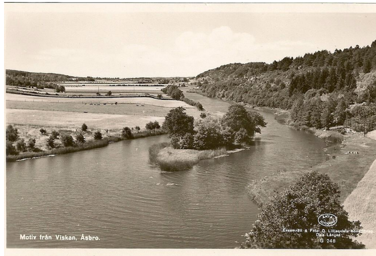
Bild över Viskan västerut mot havet